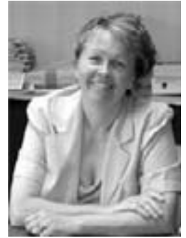
Adjointe à l'urbanisme, aux affaires scolaires et Bulletin d'informations municipales

La promotion du développement durable est devenue, pour toutes les politiques publiques, une obligation affirmée au plus haut niveau et depuis peu dans la Constitution. L'aménagement et le développement durables des territoires sont aujourd'hui des préoccupations quotidiennes de l'action publique. Ils répondent en cela à une aspiration de plus en plus forte de nos concitoyens.