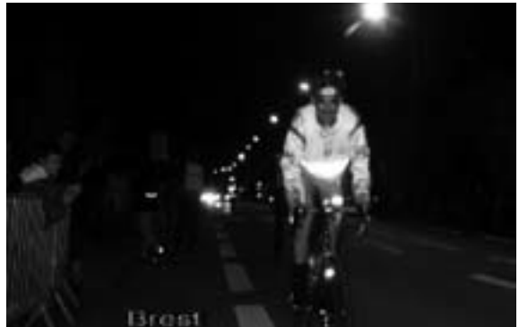
On roule encore même la nuit et sous la pluie !