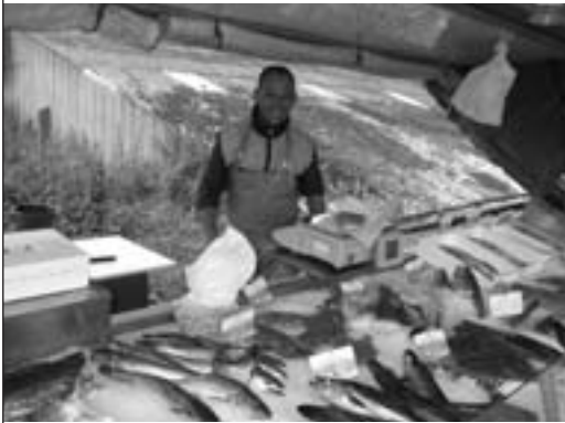
Permanence au parking de la Boulangerie Cottin : les mardis et samedis