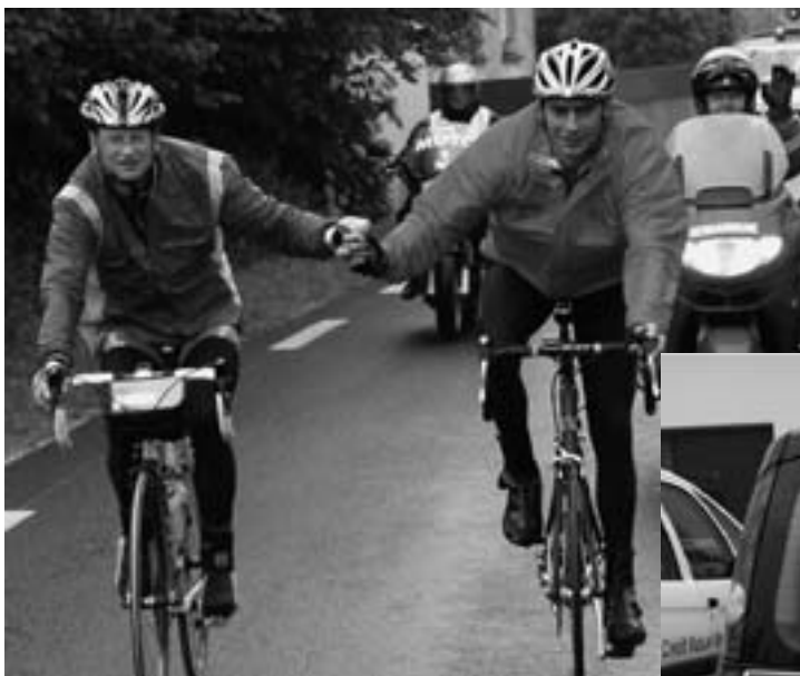
Notre duo arrive à Carhaix sous la pluie et devant le peloton