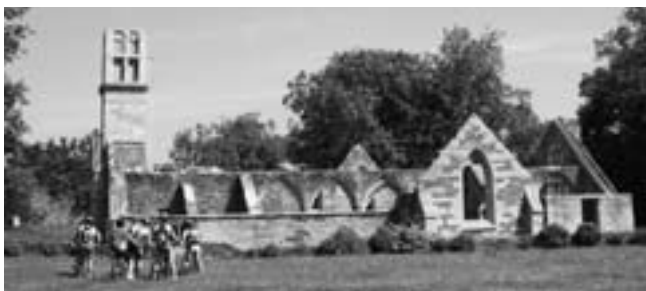
Découverte du patrimoine

La traditionnelle sortie familiale sur 2 jours a eu lieu à Loctudy où des membres du club de Pont-l'Abbé nous ont fait découvrir la région.