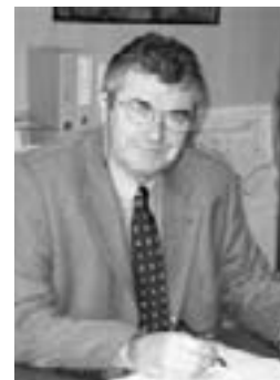
Adjoint aux finances et camping

En cette fin d'année 2007, voici quelques commentaires et explications sur le bilan de la saison estivale au camping, ainsi que sur l'évolution des tarifs pour l'année 2008, avec les réserves que nous impose la période pré-électorale.