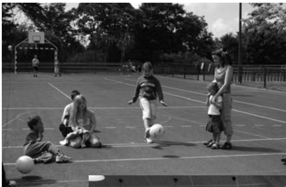
Séries de tir pendant les olympiades