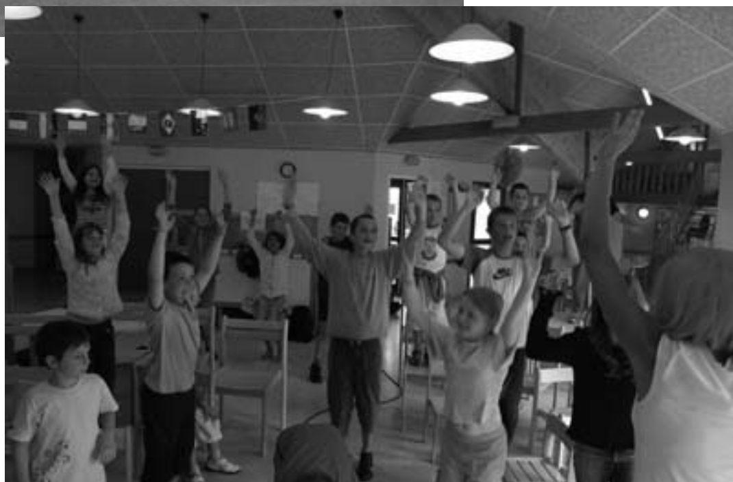
Qui veut gagner des bonbons... finit toujours en chanson