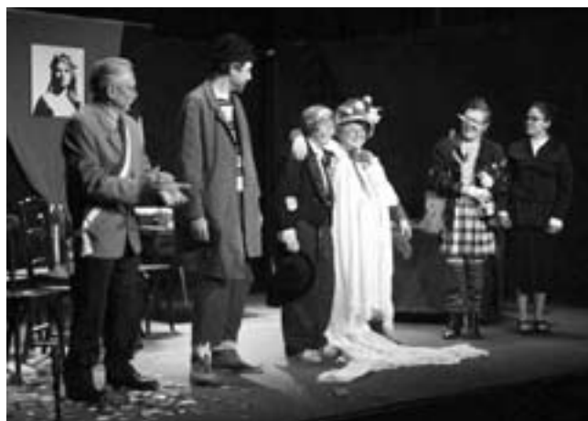
« Paluche se marie » joué en mars 2007