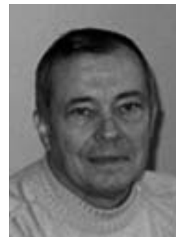
Adjoint aux affaires sportives et centre aéré